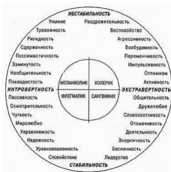
Рисунок 2. Личностные качества, присущие различным типам темперамента согласно факторной теории личности Г.Ю. Айзенка

В таком случае, для улучшения точности и подтверждения полученных результатов, личностные качества, диагностированные в рамках исследуемых речевых стратегий скрытого воздействия, сопоставляются с представленной на рисунке 2 схемой.