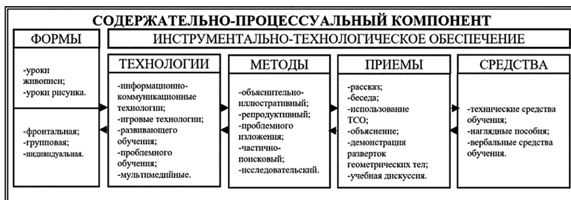
Рис. 1. Содержательно-процессуальный компонент

Методы обучения в модели представлены на основе классификации И. Я. Лернера и М. Н. Скаткина — по характеру познавательной деятельности обучающихся [4, с. 118]. В свою очередь, приемы обучения — это составная часть того или иного метода. Комплекс средств в модели методической системы должен обеспечить выполнение заданий и упражнений в соответствии с последовательностью действий, направленных на достижение положительного результата и решение поставленных задач. Описанные элементы представлены ниже (рис. 1).