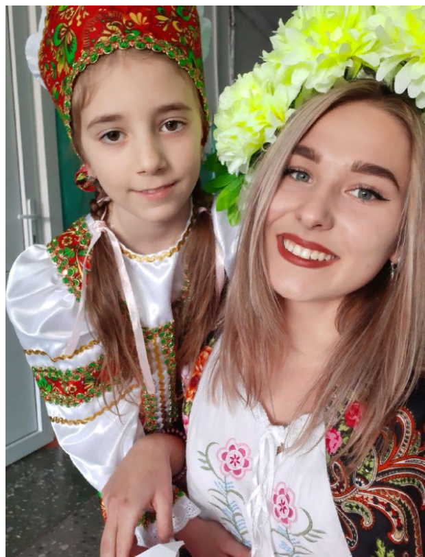
Совместное посещение разных мероприятий.

момент вернуться к памятному дню. Модные сейчас фотосессии могут стать хорошей традицией, особенно в семьях, где есть дети. Ведь каждый возраст малыша имеет свои прелести, а время летит так быстро, что опомниться не успеешь. К тому же к такому событию обычно идут долгие совместные приготовления, а саму съемку ребенок воспримет как приключение.